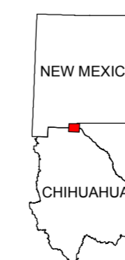
MAP LOCATION MAPA DE LOCALIZACION