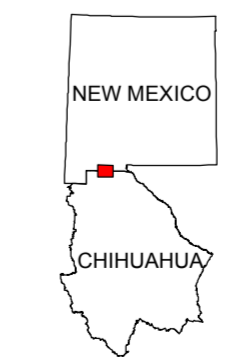
MAP LOCATION MAPA DE LOCALIZACION