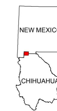
MAP LOCATION MAPA DE LOCALIZACION