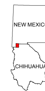
MAP LOCATION MAPA DE LOCALIZACION