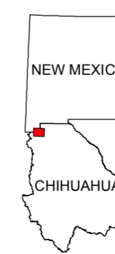
MAP LOCATION MAPA DE LOCALIZACION