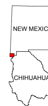
MAP LOCATION MAPA DE LOCALIZACION