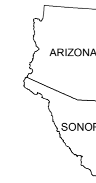
MAP LOCATION MAPA DE LOCALIZACION