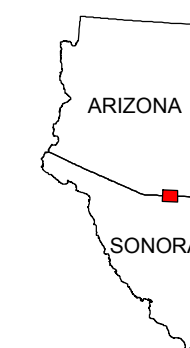
MAP LOCATION MAPA DE LOCALIZACION