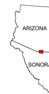
MAP LOCATION MAPA DE LOCALIZACION