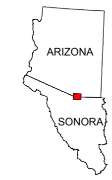
MAP LOCATION MAPA DE LOCALIZACION