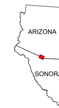
MAP LOCATION MAPA DE LOCALIZACION