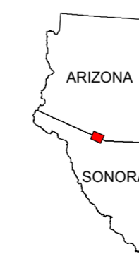
MAP LOCATION MAPA DE LOCALIZACION