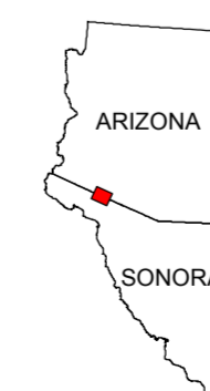
MAP LOCATION MAPA DE LOCALIZACION