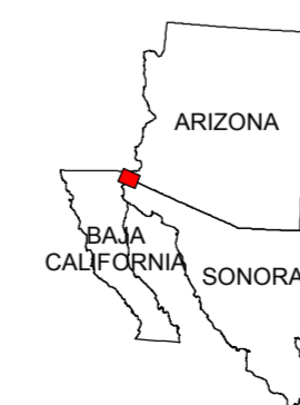
MAP LOCATION MAPA DE LOCALIZACION