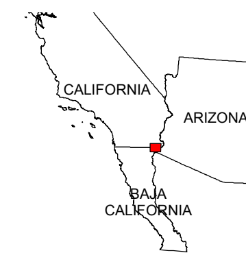
MAP LOCATION MAPA DE LOCALIZACION