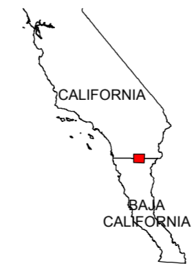
MAP LOCATION MAPA DE LOCALIZACION