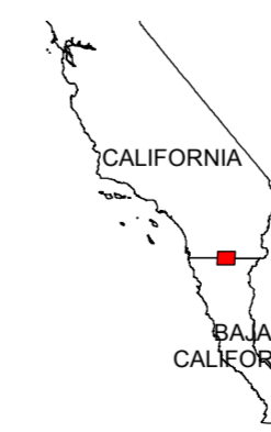
MAP LOCATION MAPA DE LOCALIZACION