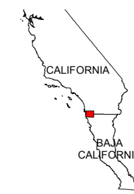
MAP LOCATION MAPA DE LOCALIZACION